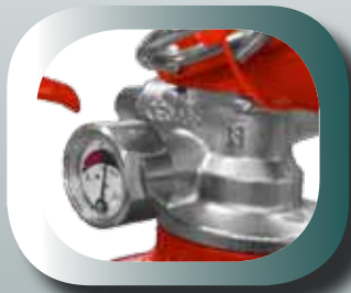
Robinetterie en laiton nickelé