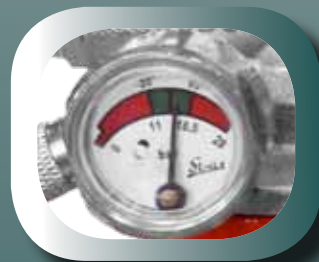
Lecture claire et simple de la pression